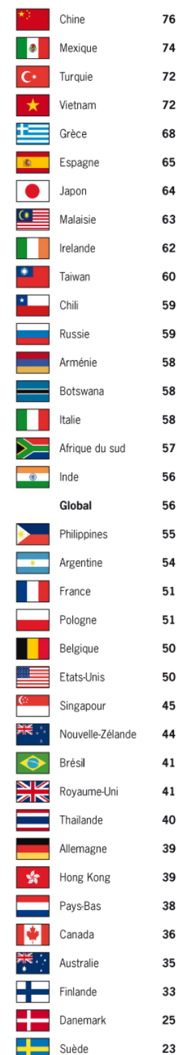
Schéma 1 : Pourcentage d'entreprises indiquant un niveau de stress plus élevé qu'il y a un an